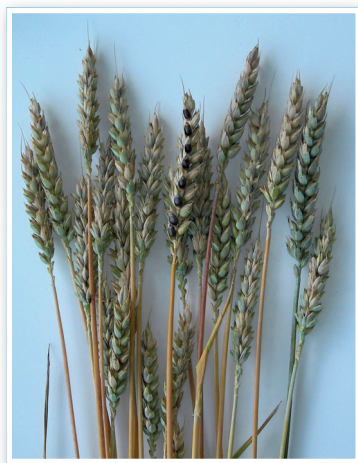
Obr. 1 – Klasy odrůdy AF Zora v mléčně-voskové zralosti s částečně obnaženými obilkami

Řešení může spočívat v zásadním kvalitativním zlepšení pšenice seté, které by mohlo být dosaženo vyšlechtěním odrůd s vysokým obsahem flavonoidů (především antokyanů), fenolických kyselin a karotenoidů (především luteinu), jež jsou významnými látkami s antioxidačním účinkem. V tomto směru se jeví jako perspektivní orientace na odrůdy s odlišným zbarvením zrna, takzvané barevné pšenice. Velmi významné z tohoto pohledu