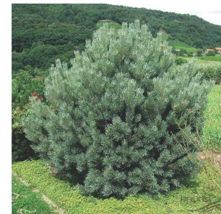
Pinus sylvestris 'Watereri'