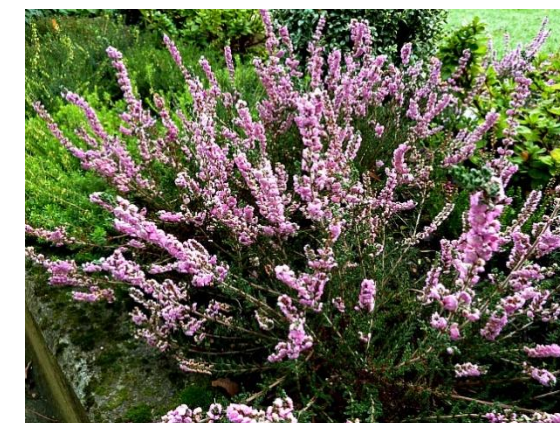
Calluna vulgaris 'Annemarie'