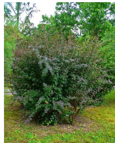
Berberis vulgaris 'Atropurpurea'