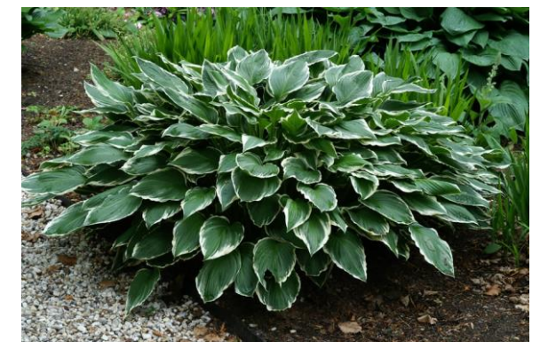
Hosta fortunei 'Francee'