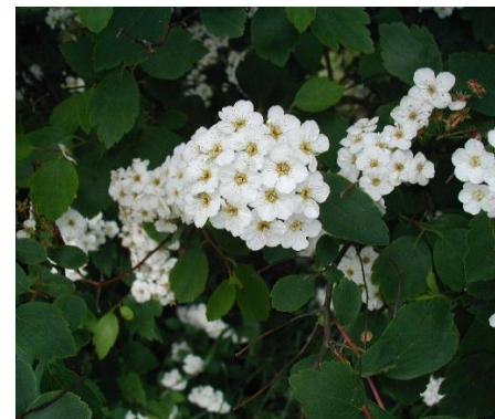
Spiraea x vanhouttei