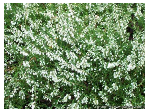
Calluna vulgaris 'Alba plena'