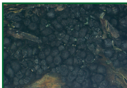
Napadené pupeny s plodnicemi houby.

houby), z níž vyrůstají četné drobné šedočerné hnědé až černé zbarvené kulovité plodnice (o průměru většinou do 1 mm), dobře viditelné pouhým okem či slabou lupou. Ty mohou pokrývat i celý napadený pupen.