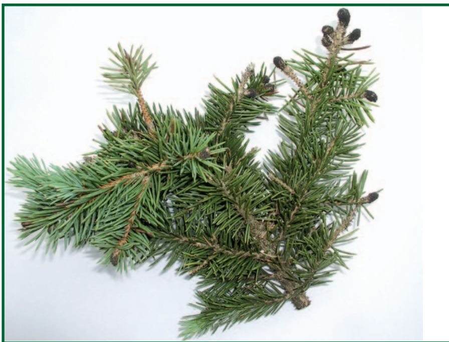
Větve smrku pichlavého s napadenými pupeny.

Daleko komplikovanější situace je při plošně rozsáhlém silném napadení lesních porostů s vysokým procentuálním zastoupením k infekci náchylných dřevin (jako je smrk pichlavý), ke kterému došlo v současné době v Krušných horách. Zde se velkoplošné využití chemické ochrany jeví jako nereálné. Lze doporučit pečlivé vyhodnocování stupně poškození jednotlivých porostů se smrkem pichlavým a na tomto základě stanovit pořadí naléhavosti přeměny těchto porostů.