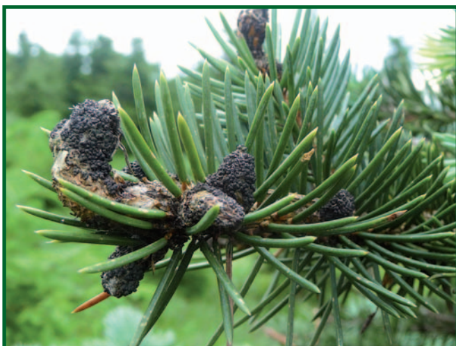
Větve smrku pichlavého s napadenými pupeny.