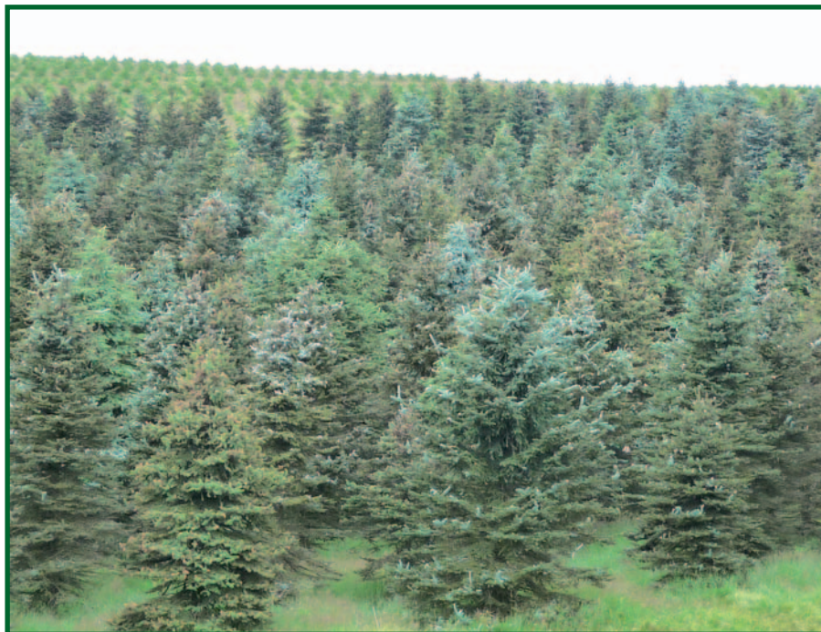
Porosty smrku pichlavého parazitované kloubnatkou smrkovou.

Při orientačním šetření v dalších našich horských oblastech, kde byl ve zvýšené míře k zalesnění kalamitních imisních holin použit smrk pichlavý, jsme prokázali přítomnost houby i v Orlických horách a (v daleko menší míře) i v Jizerských horách. Kloubnatku smrkovou se nám dále podařilo nalézt na smrku pichlavém v masívu Králického Sněžníku a oblasti Lysé hory v Moravskoslezských Beskydech.