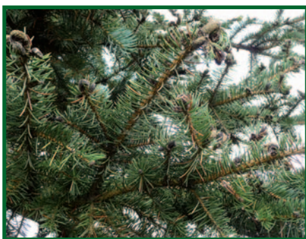
Větve smrku pichlavého s napadenými pupeny.

Možnost a účelnost použití obranných opatření proti kloubnatce smrkové je zásadně rozdílná ve školkařských zařízeních (event. výsadbách