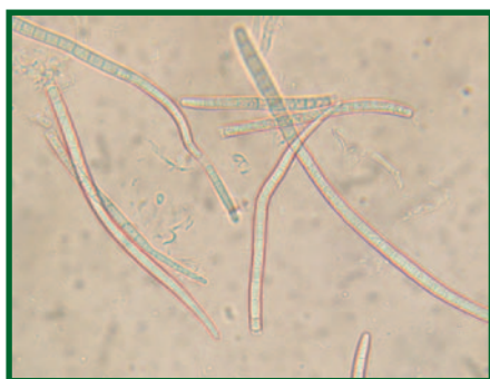
Výtrusy kloubnatky smrkové. Konidie Megaloseptoria mirabilis .

Gemmamyces piceae (Borthw.) Casagr. (syn.: Cucurbitaria piceae Borthw., anamorfa Megaloseptoria mirabilis Naumov) je vrčkovitá houba (Ascomycetes) řazená do řádu Pleosporales, čeledi Cucurbitariaceae, platně popsána poprvé před sto lety.