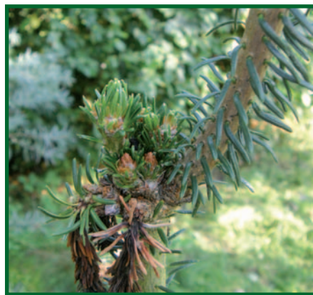
Poškození pupenů jedle bělokoré mrazem.

K na první pohled poněkud podobnému odumírání pupenů může dojít i působením abiotických faktorů. I v tomto případě pupeny na jaře nevyraší, časem hnědnou a zasychají, avšak nikdy nečernají. Nejčastější příčinou poškození ještě nevyzrálých pupenů bývá v tomto případě časný mráz. S tímto poškozením se daleko častěji setkáváme v lesních školkách či plantážích vánočních stromků.