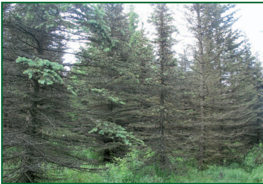
Porosty smrku pichlavého parazitované kloubnatkou smrkovou.

Nebezpečí, resp. „zákeřnost“ kloubnatky smrkové spočívá především v tom, že život napadeného jedince bezprostředně neohrožuje. Je-li procento napadených (a odumřelých) pupenů nižší, strom není v růstu nijak významněji omežován. Překročili-li však počet napadených a odumřelých pupenů 3/4 celkového počtu několik let po sobě, popř. dojde-li k napadení prak-