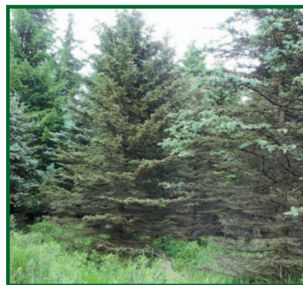
Porosty smrku pichlavého parazitované kloubnatkou smrkovou.