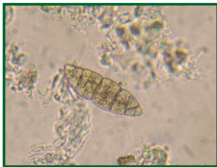
Výtrusy kloubnatky smrkové. Askospora Gemmamyces piceae .

K infekci hostitelské dřeviny dochází během vegetačního období. Od konce jara, resp. začátku léta se napadené odumřelé pupeny, nezřídka zdeformované (jakoby „vykloubené“) při pokusu o vyrašení, pokrývají černou tuhou krustou (bazálním stromatem).